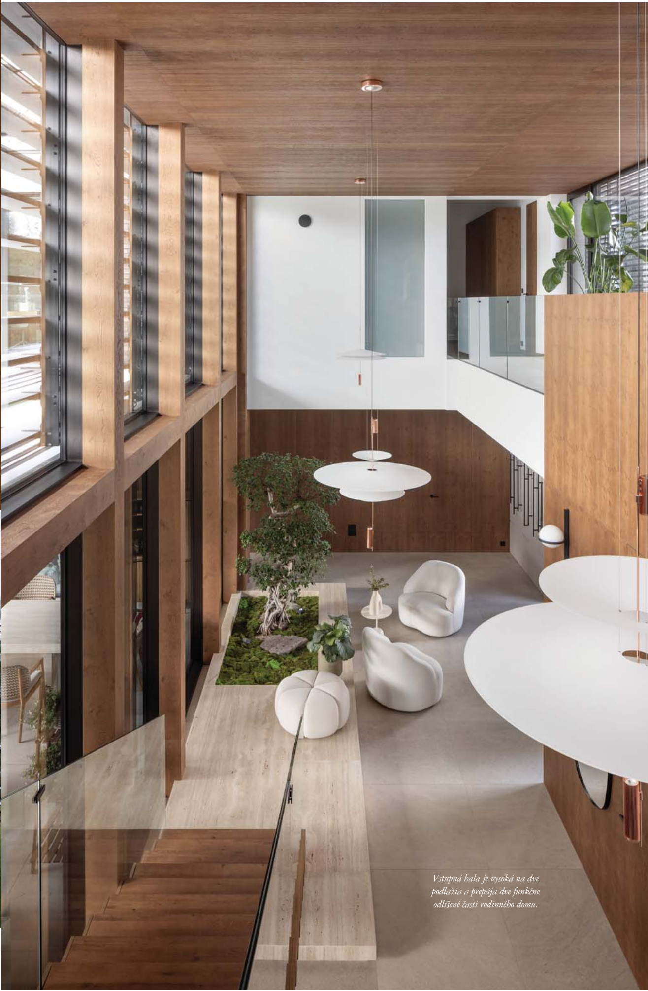
Vstupná hala je vysoká na dve podlažia a prepája dve funkčne odlišné časti rodinného domu.