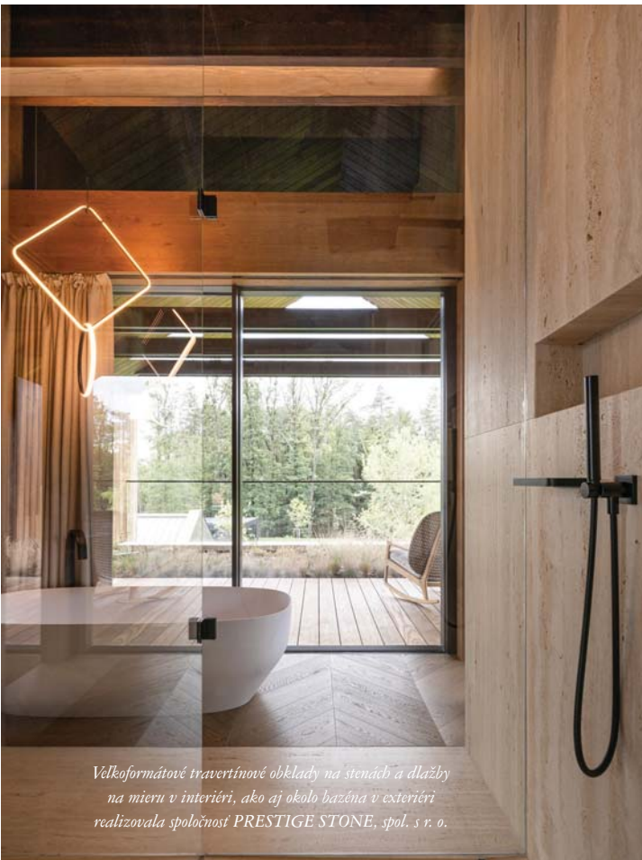
Velkoformátové travertínové obklady na stenách a dlažby na mieru v interiéri, ako aj okolo bazéna v exteriéri realizovala spoločnosť PRESTIGE STONE, spol. s r. o.

Vonkajší pohľad na stavbu naznačí harmonické splynutie s okolím – v bezprostrednej blízkosti sa nachádza borovicový les.