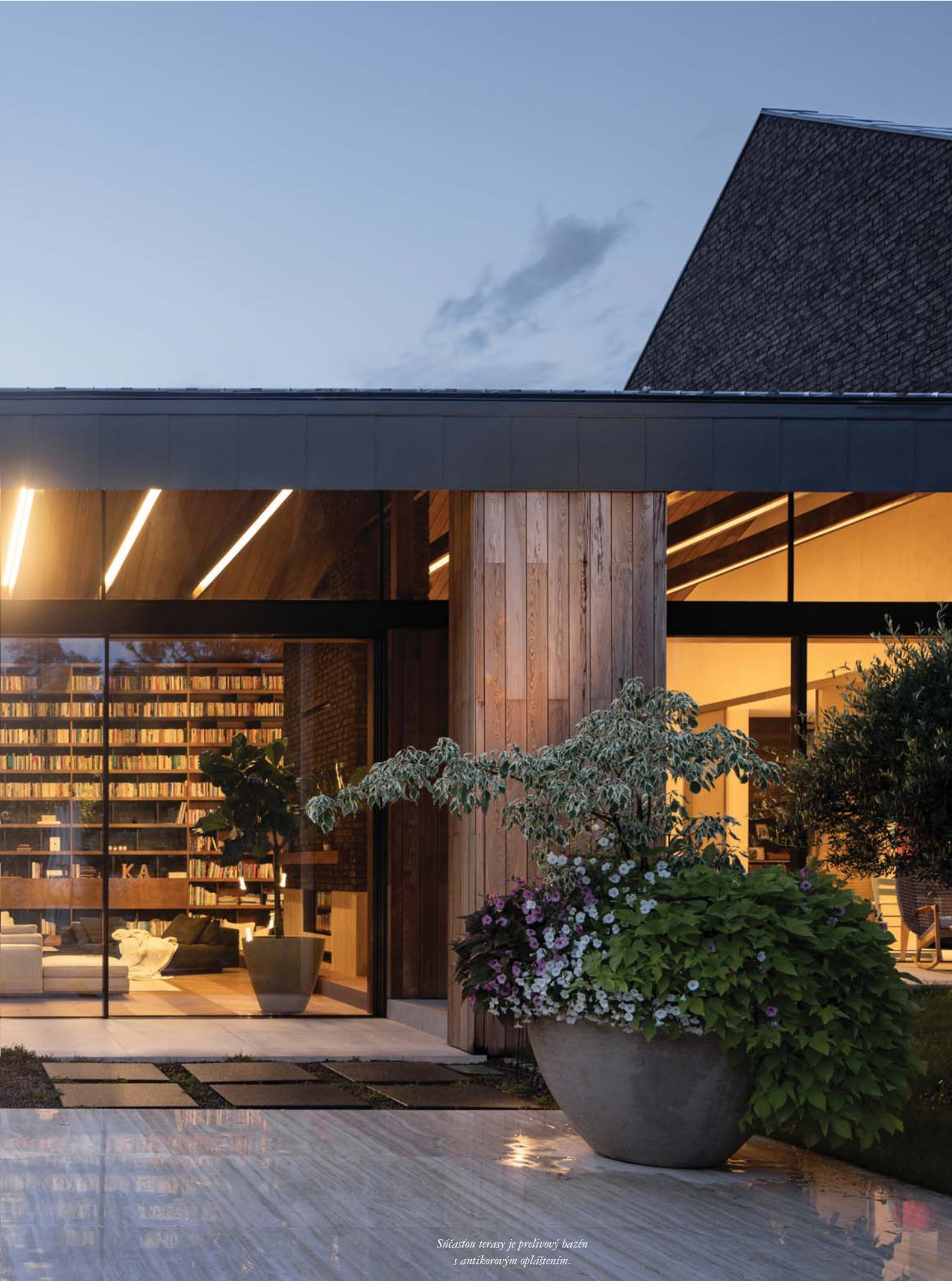
Súčasťou terasy je prelivový bazén s antikoróznym opláštením.